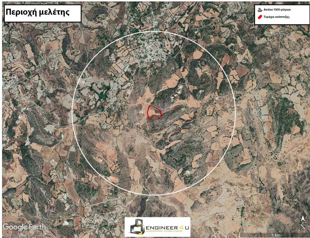
Εικόνα 2: Περιοχή μελέτης

Τα χαρακτηριστικά της περιοχής ανάπτυξης που μελετήθηκαν παρουσιάζονται στον Πίνακα 1.